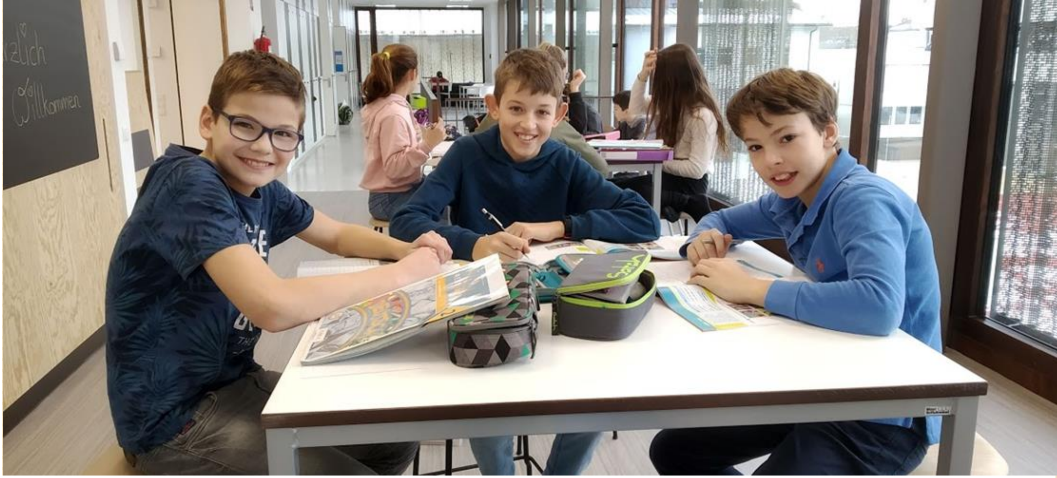
Schüler im Lernbüro.