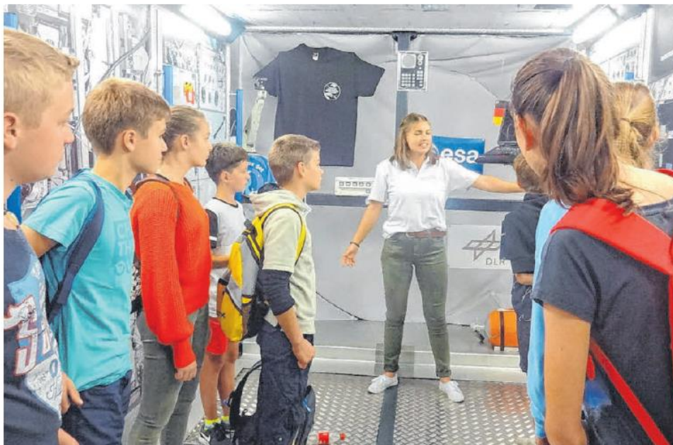
Diverse Exkursionen und Betriebsbesichtigungen schärfen das technische Verständnis der Schüler.